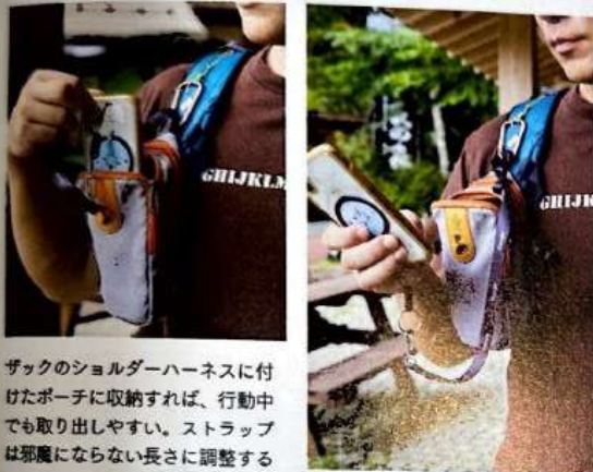
ザックのショルダーハーネスに付けたポーチに収納すれば、行動中でも取り出しやすい。ストラップは邪魔にならない長さに調整する

山でのスマホの落下は、衝撃による破損だけではなく、回収不能な場所(急斜面下の谷底など)に落ちるリスクがある。必ずストラップを付けて、ザックなどにつないでおく。また、必要なときにすぐに取り出せるところに収納しておくことも大切。