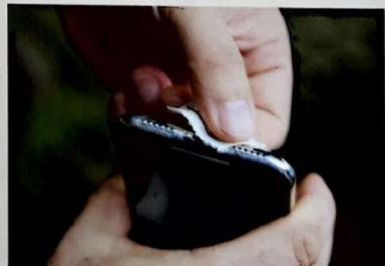
充電口に水が入っても壊れることはないが、水分を検出するとエラーメッセージが表示されて充電不可となる。水の浸入を防ぐことが大切

最近のスマホの多くは防水機能を備えており、多少濡れても壊れる心配はない。ただし、充電口に水が入ると、乾くまで充電できなくなってしまうので注意したい。雨の日の山行や、沢登りに行くときには、念のため充電口をビニールテープなどで覆っておく。