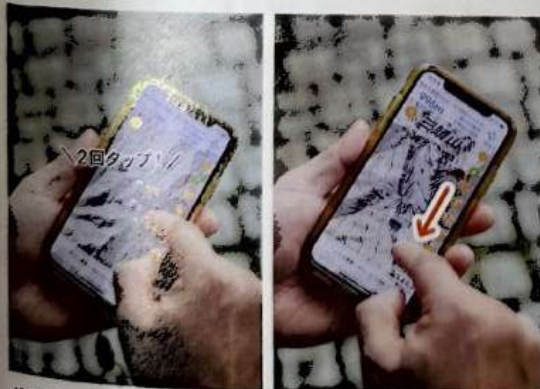
ダブルタップした指を、そのまま下方向に移動させると地図は拡大、上方向に移動させると縮小する。指1本で操作できるので便利

スマホ画面の地図を拡大・縮小するには、2本の指を広げたり、閉じたりする操作が一般的だが、ほかの方法もある。地図をダブルタップして、2回目のタップを長押し。そのまま指を上下にスライドさせると拡大・縮小できる。タッチペン使用時におすすめ。