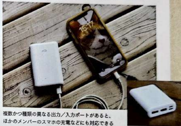
複数かつ種類の異なる出力/入力ポートがあると、ほかのメンバーのスマホの充電などにも対応できる

スマホはバッテリーが切れたら使えなくなるので、充電用のモバイルバッテリーの携行は必須だ。また、バッテリー残量が少なくなると電圧が下がり、寒冷環境下ではシャットダウンしやすくなる。残量が50%を下回ったら、早めに充電をしたほうがよい。